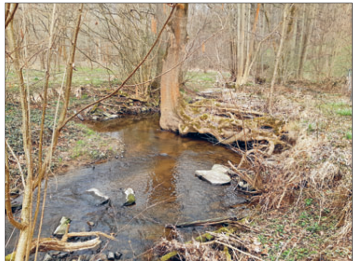
Dieser Baum ist ein perfekter Unterstand für Fische. Er kann vor Fressfeinden schützen und im Sommer Abkühlung bringen.

Und genau deshalb sollten Gewässer wieder in einen naturnahen Zustand gebracht werden. Damit es wieder mehr Vielfalt an Lebewesen am und im Gewässer gibt. So können sich wieder Bachforellen, Äschen und andere Fische ansiedeln. Auch Insekten, Vögel und weitere Tiere fühlen sich dann wohl. Schließlich profitieren auch wir davon – beispielsweise, wenn wir wieder mehr Fisch aus unseren heimischen Fließgewässern essen können. Und im Sommer sitzen wir auch lieber an einem beschatteten Bach als an einer Betonrinne in der prallen Sonne. Dieser Text entstand in Zusammenarbeit der Fachberaterinnen und Fachberater Gewässer des Landesamtes für Umwelt, Landwirtschaft und Geologie und der unteren Wasserbehörde des Landkreises.