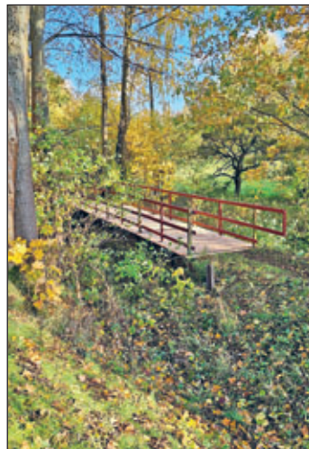
Zwei von drei umfassend instand gesetzten Wanderwegbrücken auf dem Wanderweg Bahndamm in Reinsberg in Zusammenarbeit zwischen dem Bauhof und der Tischlei Mirko Sittner wurden fertiggestellt.

Aus verwaltungstechnischen Gründen bleiben am Dienstag, dem 23.12.2025 das Einwohnermeldeamt und das Bürgerbüro geschlossen. Ab 24.12.2025 bis einschließlich 02.01.2026 ist das Rathaus geschlossen.